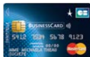
MASTERCARD® BUSINESSCARD ESSENTIELLE

Vous bénéficiez de services d'assistance et d'assurance renforcés en France comme à l'étranger