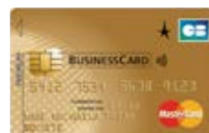
MASTERCARD® BUSINESSCARD PREMIUM